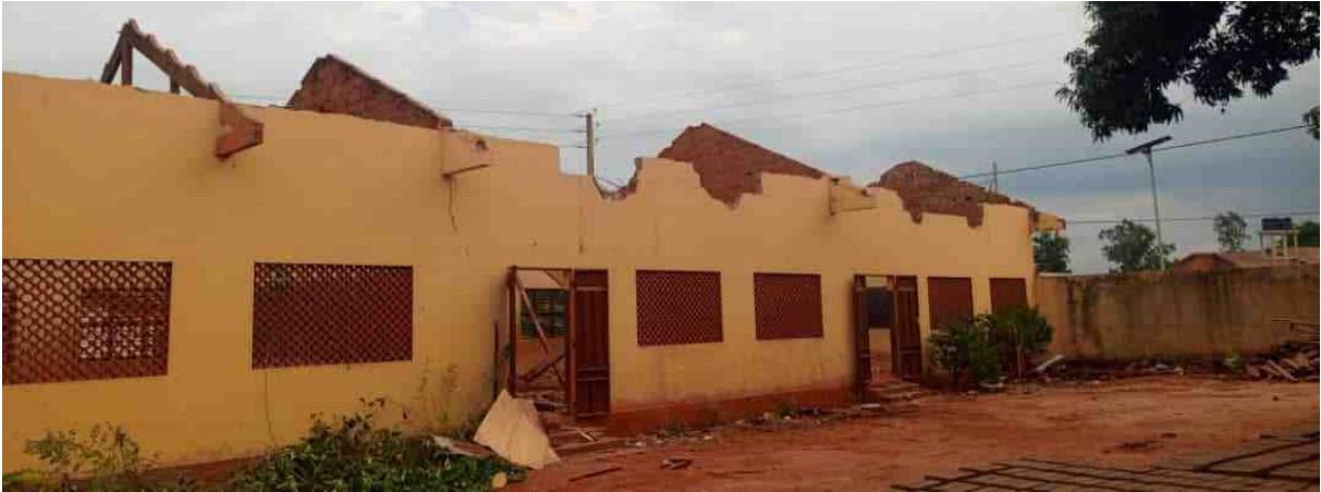
Dachdemontage fast abgeschlossen