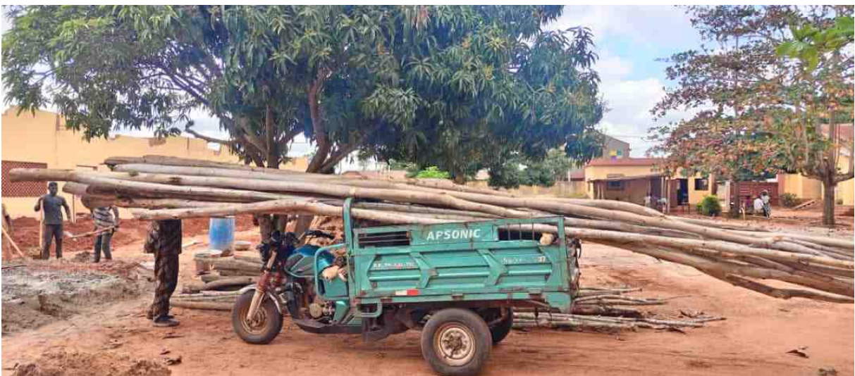
Anlieferung von Teakholzstämmen