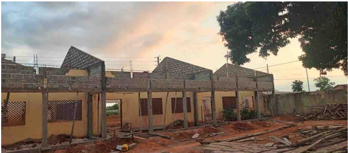
Neu gemauerte Giebel - Dacherhöhung