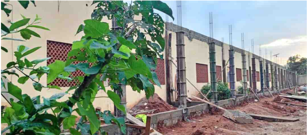
Die Pfeiler für die Veranda wurden gegossen