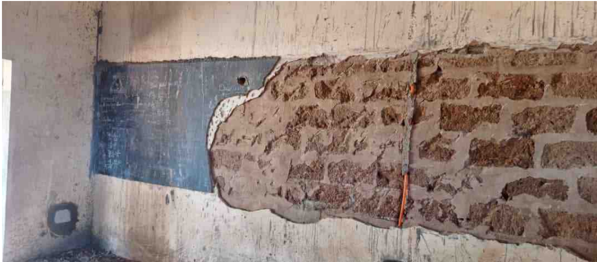
Zwischenwand mit Resten einer Wandtafel - vor der Renovierung