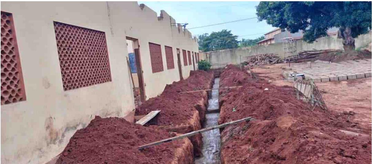
Das Fundament für die Veranda wird gelegt